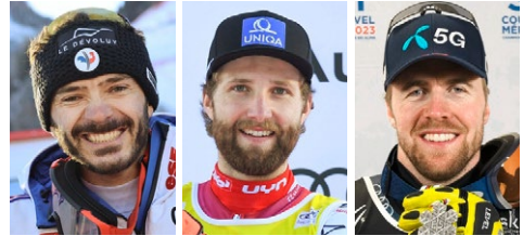
Cyprien Sarrazin, Marco Schwarz, Aleksander Aamodt Kilde (v.l.).

Einer der grössten Rivalen Odermatts ist der Franzose Cyprien Sarrazin - einer der wenigen, denen es gelingt, Odi in den Schatzen zu stellen. Wie zuletzt bei der Abfahrt in Kitzbühel. Für Odermatt kein Grund für schlechte Laune. Die beiden Ausnahmesportler feierten gemeinsam die Plätze eins und zwei in einem Kitzbüheler Nachtclub. Für Marco Schwarz , Odermatts härtesten Konkurrenten aus Österreich, endete die Saison nach einem schweren Sturz bereits Ende Dezember. Auch der norwegische Skistar Aleksander Aamodt Kilde hat sich verletzt - mit einem schnellen Comeback wird nicht gerechnet. Auf der Rennstrecke sind Gino Caviezel und Justin Murisier Odermatts Gegner. Doch die drei sind seit Jahren enge Freunde.